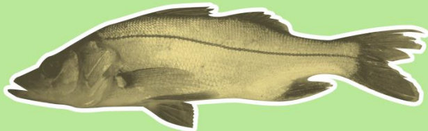
Robalo/snook mínimo 22” y máximo de 38” (559mm) de LH