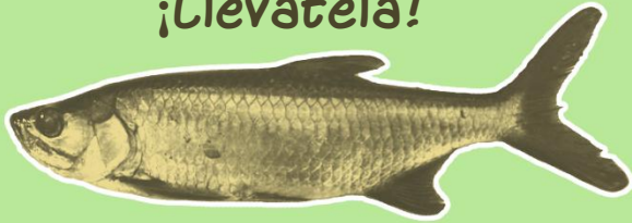
Sábalo/tarpon captura y liberación “catch and release”